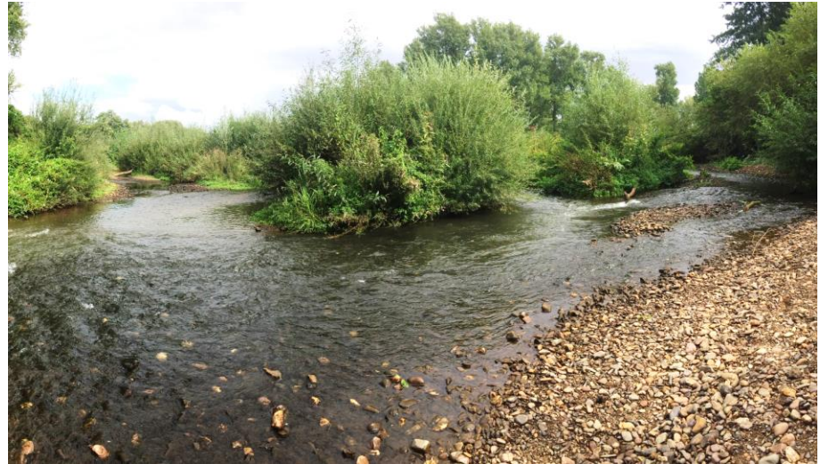
Mündung der Inde in die Rur

→ Bewirtschaftung nach EU-Wasserrahmenrichtlinie (WRRL) vom 22.12.2000